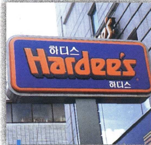
PARA AVISOS LUMINOSOS IRROMPIBLES