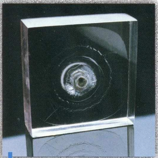
PARA BLINDAJES DE EDIFICIOS Y VEHICULOS

El policarbonato es uno de los polímeros más avanzados y resistentes del mundo.